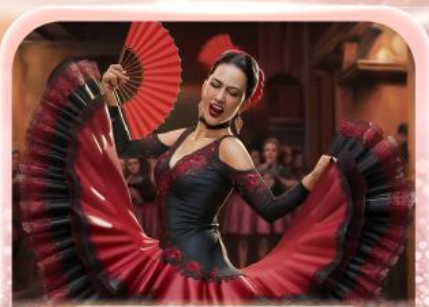
ระบำฟลามิงโก