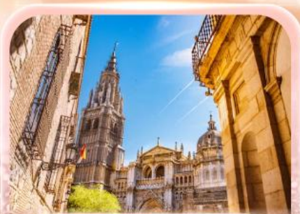
มหาวิหารแห่งโกเอลดา