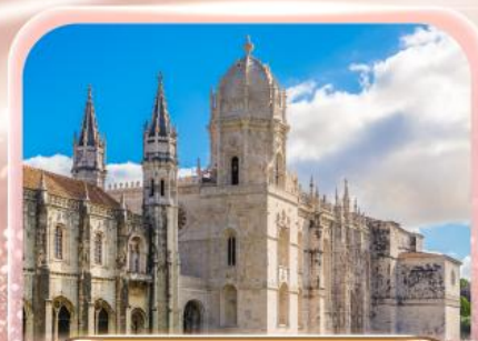
มหาวิหารเจโรนิโม