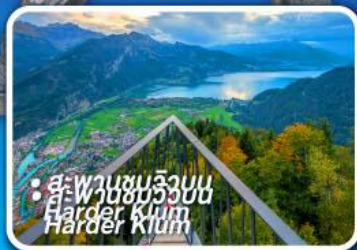
• สะพานชมวิวยอด Harder Kluem