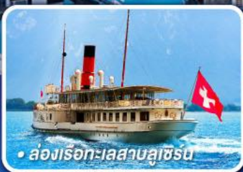
• ล่องเรือทะเลสาบลูซิร์น