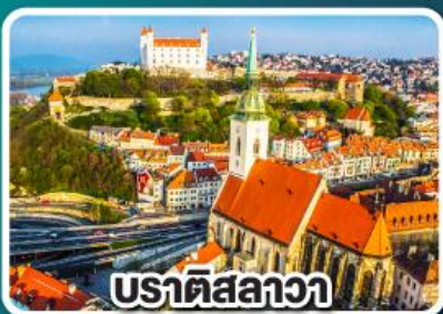
ปราตีสลาวา