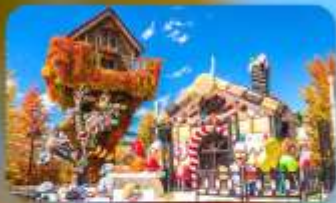
โรงงานช็อกโกแลต ซึโรอิ โคอิบิโตะ