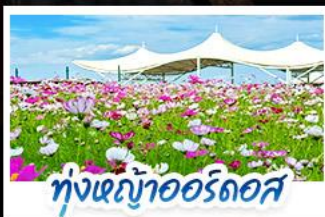
ทุ่งหญ้าเออร์โดส