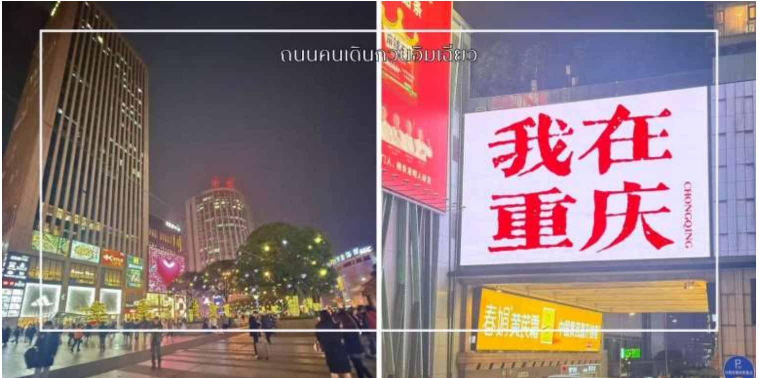
ถนนคนเดินถว้บรัมเจียว

ซึ่งอย่างแท้จริง อีกหนึ่งไฮไลท์สำคัญคือจุดถ่ายภาพยอดนิยม บ้ายไฟ 我在重庆 (I am in Chongqing) ซึ่งถือเป็นแลนด์มาร์ก เช็คอินที่นักท่องเที่ยวไม่ควรพลาด