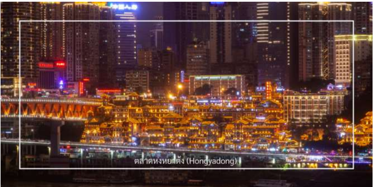
ตลาดหงหยาดัง (Hongyadong)

จากนั้นเดินทางไปยัง ตลาดหงหยาดัง (Hongyadong) หรือที่เรียกว่า "Hongya Cave" เป็นสถานที่ท่องเที่ยวที่มีชื่อเสียง ในเมืองฉงชิ่ง โดยตั้งอยู่ริมแม่น้ำแยงซี มีบรรยากาศที่เต็มไปด้วยวัฒนธรรมและประวัติศาสตร์ ตลาดหงหยาดังเป็นพื้นที่ที่มี อาคารแบบดั้งเดิมที่สร้างขึ้นในสไตล์สถาปัตยกรรมแบบชิโน-ทิเบต โดยมีร้านค้า ร้านอาหาร และบาร์จำนวนมาก ที่นี่คุณ สามารถลิ้มลองอาหารท้องถิ่นที่อร่อย เช่น ฮอทพอตหงชิ่ง (Chongqing Hot Pot) และขนมพื้นเมืองอื่นๆ นอกจากนี้ ตลาด หงหยาดังยังมีวิวทิวทัศน์ที่สวยงาม โดยเฉพาะในช่วงเย็นเมื่อไฟประดับส่องสว่าง ที่ทำให้บรรยากาศมีความโรแมนติกและน่า ตื่นเต้น คุณสามารถเดินเล่นตามทางเดินที่มีการจัดแสดงงานศิลปะและสินค้าท้องถิ่น