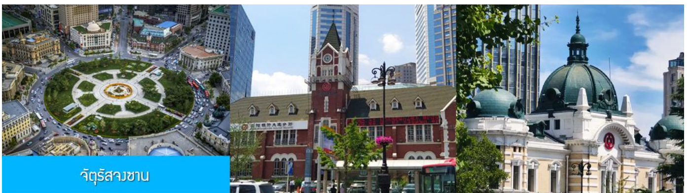
จัตุรัสวงเวียน

จากนั้นนำท่านเที่ยวชม อ่าวหลิงเจี้ยว 菱角湾 เป็นอ่าวธรรมชาติและแลนด์มาร์กถ่ายรูปสุดฮิตในเมืองต้าเหลียน ประเทศจีน โดดเด่นด้วยทิวทัศน์บ้านเรือนสีสดใสใต้อาคารเรียงรายริมน้ำ จนได้รับฉายาว่า "Little Santorini แห่งต้าเหลียน" และเป็นจุดชมพระอาทิตย์ตกที่สวยงามมากแห่ง