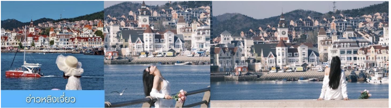
อ่าวหลิงเจี้ยว

จากนั้นนำท่านเที่ยวชม อ่าวหลิงเจี้ยว 菱角湾 เป็นอ่าวธรรมชาติและแลนด์มาร์กถ่ายรูปสุดฮิตในเมืองต้าเหลียน ประเทศจีน โดดเด่นด้วยทิวทัศน์บ้านเรือนสีสดใสใต้อาคารเรียงรายริมน้ำ จนได้รับฉายาว่า "Little Santorini แห่งต้าเหลียน" และเป็นจุดชมพระอาทิตย์ตกที่สวยงามมากแห่ง