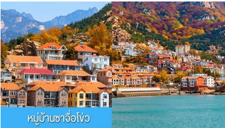
หมู่บ้านชาวโจว