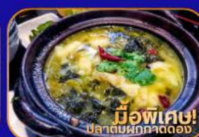
มือพิเศษ! ปลาต้มผักกาดดอง