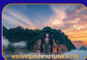
พระใหญ่เล่อซาน (UNESCO)

ล่องเรือชม "พระใหญ่เล่อซาน" - เมืองโบราณหวงหลงซี - แพนด้าเซลฟี - ห้องสมุดจงซูเก้อ - Wangjianglou Park - ถนนชุนซีลู่ (แหล่งช้อปปิ้ง) - IFS (แพนด้าปิ่นตึก) - วัดต้าจื่อ