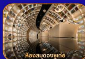
ห้องสมุดจงซูเก้อ