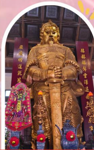
วัดเซกวง ขอพรโชคลาภ การเงิน และธุรกิจ