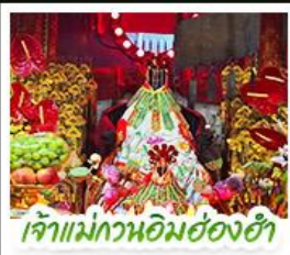
เจ้าแม่กวอนอิมฮ่องฮ่า