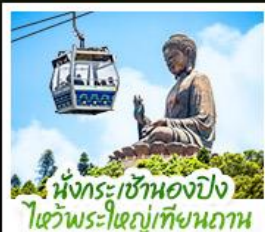
นั่งกระเช้าเองปีง ไหว้พระใหญ่เทียนทาน