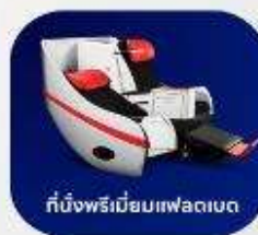
ที่นั่งพรีเมียมแพลนเน็ต