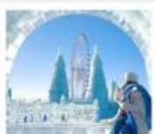
ICE & SNOW FEST.