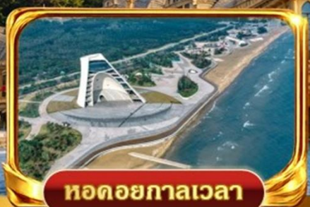
หอดอยกาลเวลา