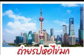
ถ่ายรูปไข่มุก