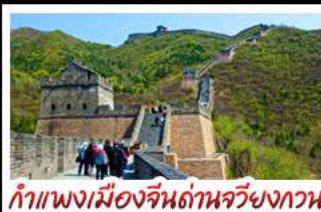
กำแพงเมืองจีนด้านจวิ้นกวน

รถไฟความเร็วสูง - ถ่ายรูปห่อไข่มุก กำแพงเมืองจีนด้านจวิ้นกวน มือพิเศษ เปิดปักกิ่ง, สุกี่หม้อไฟ BUFFET