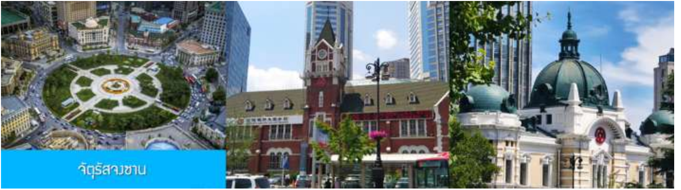
จัตุรัสสวน