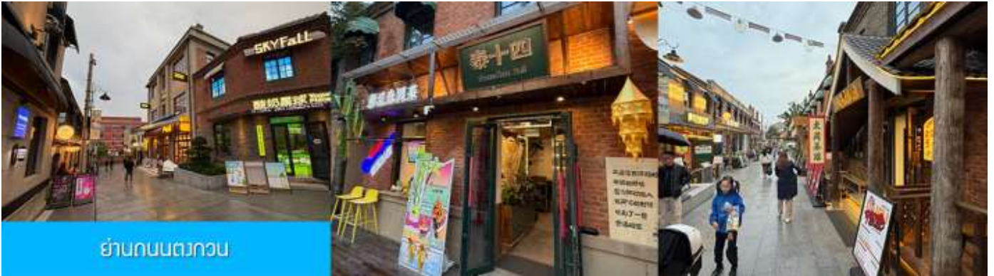
ย่านถนนตงกวน

นำท่านเที่ยวชม จัตุรัสชิงไห่ 星海广场 เป็นจัตุรัสขนาดใหญ่เป็นแลนด์มาร์คสำคัญของเมืองต้าเหลียน สร้างขึ้นเพื่อเฉลิมฉลองในโอกาสที่รัฐบาลอังกฤษคืนเกาะฮ่องกงในให้จีนในปี ค.ศ. 1997 ตั้งอยู่ชายฝั่งทะเลในเมืองต้าเหลียน เป็นจัตุรัสใจกลางเมืองที่ใหญ่ที่สุดในโลกและ เป็นแลนด์มาร์คของเมืองต้าเหลียน รายล้อมด้วยตึกกระจาที่ทันสมัย ภายในมีบ่อน้ำพุดนตรี ลานหญ้าขนาดใหญ่ และลานกว้างสำหรับจัดกิจกรรมกลางแจ้ง อาทิ เทศกาลเบียร์นานาชาติ การแข่งขันวิ่งมาราธอน งานแฟชั่นนานาชาติเมืองต้าเหลียน ฯลฯ