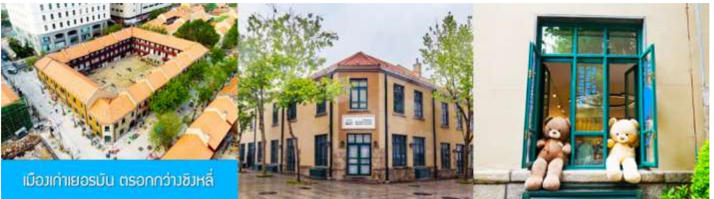
เมืองเก่าเยอรมัน ตรอกกว้างชิงหลี่

จากนั้นนำท่านเดินเที่ยวชม ถนนจงซาน 中山路 ถนนที่เต็มไปด้วยกลิ่นอายยุโรป และถนนสายนี้มีบันทึกรื่องราวมากกว่าศตวรรษของเมืองชิงเต่าไว้ ที่นี่เป็นศูนย์กลางการค้าแห่งแรกที่เต็มไปด้วยสถาปัตยกรรมสไตล์ยุโรปเก่าแก่ที่ได้รับอิทธิพลมาจากเยอรมัน ให้ท่านได้เดินเก็บบรรยากาศ และ เก็บภาพกับโบสถ์เซนต์ไมเคิล (ด้านนอก) โบสถ์แห่งนี้ที่คู่รักนิยมมาถ่ายภาพงานแต่งงานกันมากที่สุดในเมืองชิงเต่า ให้ท่านถ่ายรูปเก็บภาพ