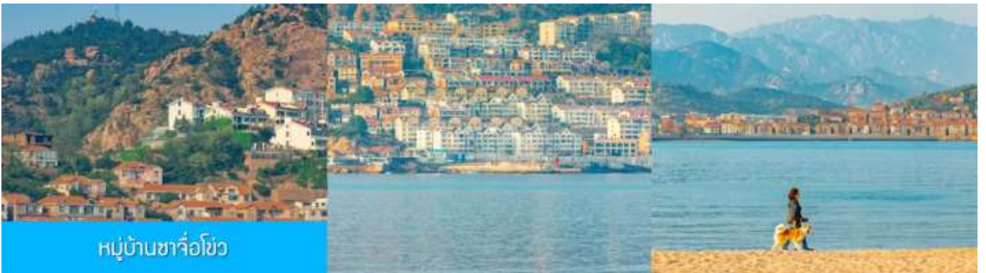
หมู่บ้านซาจื่อโจ้ว

เช้า รับประทานอาหารเช้า ณ ห้องอาหารของโรงแรม (4)