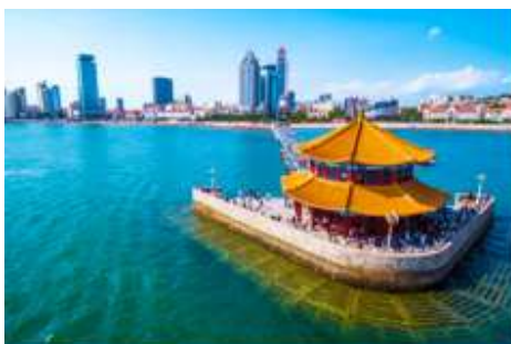
สะพานเจียนเจียว

เช้า รับประทานอาหารเช้า ณ ห้องอาหารของโรงแรม (1)