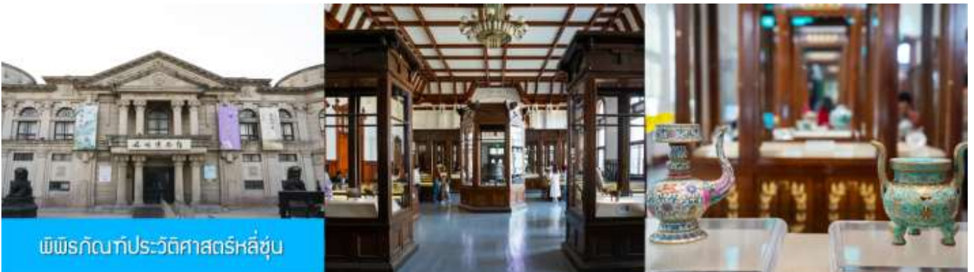
พิพิธภัณฑ์ประวัติศาสตร์หลี่ซุ่น

นำท่านเที่ยวชมและเก็บภาพ ณ สถานีรถไฟหลี่ซุ่น 旅顺火车站 เป็นสถานีปลายทางของเส้นทางรถไฟสาขา เลิ่นหยาง - ต้าเหลียน สร้างขึ้นในปีค.ศ. 1903 ออกแบบโดยสถาปนิกชาวรัสเซีย เป็นอาคารอิฐก่อปูนผสม โครงสร้างไม้ตามสถาปัตยกรรมรัสเซีย.