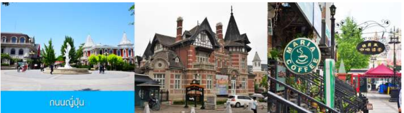
ถนนญี่ปุ่น