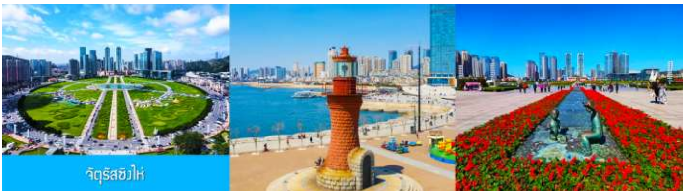
จัตุรัสฮวิ่

จากนั้นนำท่านเที่ยวชมและเก็บภาพ ณ พิพิธภัณฑ์ประวัติศาสตร์หลี่ซุ่น 旅顺博物馆 เป็นอาคารพิพิธภัณฑ์เก่าแก่อายุกว่าร้อยปีแห่งแรกที่สร้างขึ้นทางภาคตะวันออกเฉียงเหนือของจีน อาคารพิพิธภัณฑ์มีความโดดเด่นด้วยสถาปัตยกรรมแบบกรีกโรมันยุคเรเนซองส์ ผสมผสานสถาปัตยกรรมแบบตะวันออก ภายในมีการจัดแสดงโบราณวัตถุกว่า 60,000 ชิ้น ท่านสามารถเก็บภาพที่ระลึกด้านหน้าอาคารพิพิธภัณฑ์ และสามารถเข้าชมโบราณวัตถุภายในพิพิธภัณฑ์ได้ตามอัธยาศัย (พิพิธภัณฑ์ปิดทุกวันจันทร์)..