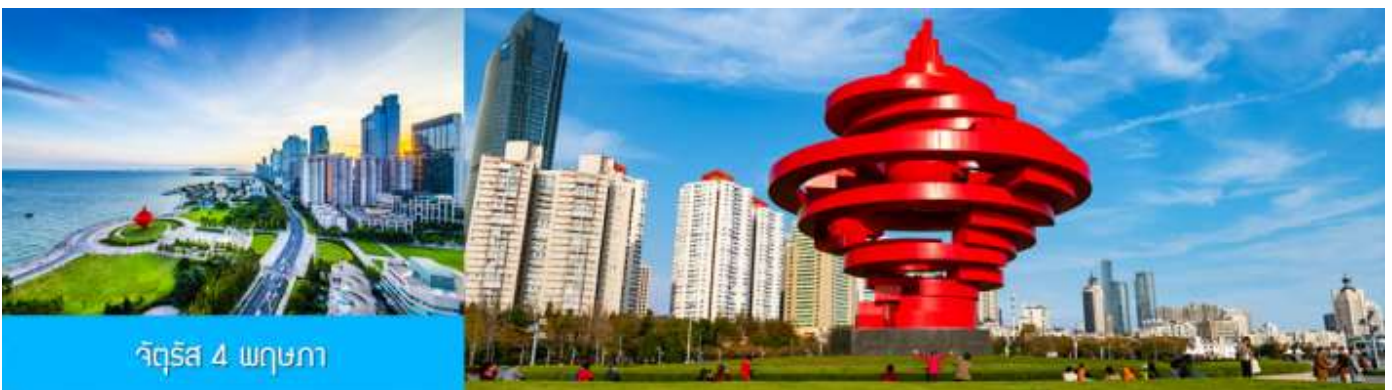
จัตุรัส 4 พฤษภาคม

จากนั้นนำท่านเที่ยวชม ศูนย์เรือใบโอลิมปิกชิงเต่า (Qingdao Olympic Sailing Center) ซึ่งเป็นสถานที่จัดการแข่งขันเรือใบในโอลิมปิกฤดูร้อน 2008 ปัจจุบันเป็นสถานที่ท่องเที่ยวชั้นนำริมทะเลที่สวยงาม มีท่าจอดเรือยอชท์, พื้นที่จัดกิจกรรม, และทิวทัศน์ที่สวยงาม ให้นำท่านเก็บภาพบรรยากาศความสวยงามตามอัธยาศัย