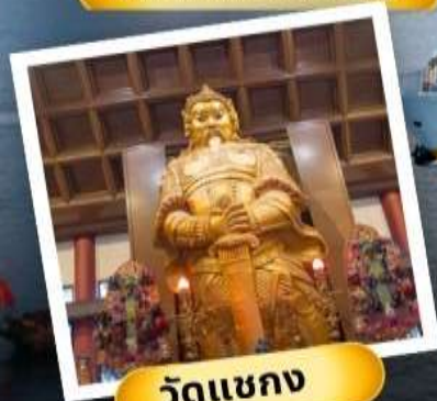
วัดเขากง