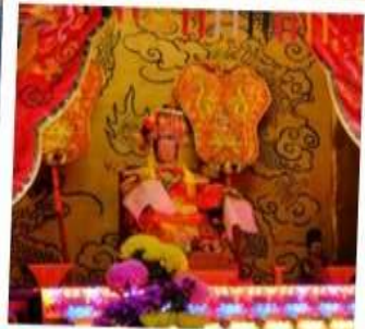
เจ้าแม่ทับทิม จอสเฮาส์เบย์