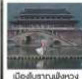
เมืองโบราณผิงหวง