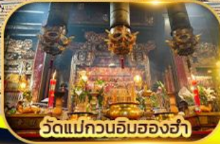
วัดแม่กวนอิมฮ่องฮ่า