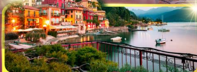
ทะเลสาบโลโบ