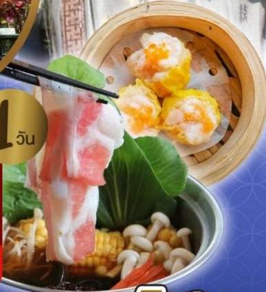
เจ้าแม่กวนอิม ริพลีสเบย์