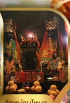
วัดบ้านใหม่