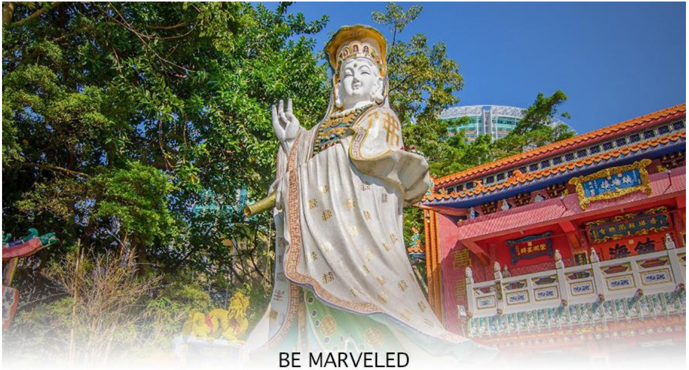
BE MARVELED วัดเจ้าแม่กวนอิมริพลัสเบย์

จากนั้นนำท่านเดินทางสู่ วัดหลินฟ้า (LIN FA KUNG TEMPLE) วัดหลินฟ้ากงอยู่ในย่านหว่านไฉ่ ตั้งอยู่บนเนินเขาหันหน้าออกสู่ทะเลทางทิศตะวันออกเฉียงใต้ของอ่าวคอสเวย์ ถึงแม้จะเป็นวัดเล็ก ๆ แต่วัดหลินฟ้า คือวัดเก่าแก่ที่มีประวัติความเป็นมาเกี่ยวข้องกับความศักดิ์สิทธิ์ของเจ้าแม่กวนอิม โดยตรงวัดนี้ตั้งอยู่บนถนนลิลี สตรีท (Lily St.) ที่เชื่อมต่อกับถนน Lin Fa Kung ตามชื่อวัดหลินฟ้า ตำนานเล่าว่า ในสมัยราชวงศ์ซิง เจ้าแม่กวนอิม หรือพระโพธิสัตว์กวนอิม ซึ่งเป็นเทพีแห่งความเมตตา ได้ปรากฏกายขึ้นบนโขดหินรูปดอกบัว (Lotus Rock) ณ บริเวณที่ตั้งของวัดในปัจจุบัน ชาวบ้านเชื่อว่าการปรากฏกายของเจ้าแม่กวนอิมเป็นสัญลักษณ์ของความโชคดีและการคุ้มครองจากภัยพิบัติต่างๆ จากจุดนี้ เราสามารถเดินเล่นเดินเที่ยวต่อไปยังถนนเส้นอื่น ๆ ได้ง่าย ตลอดเส้นทาง ทำให้วัดหลินฟ้า หรือ หลินฟ้ากง (Lin Fa Kung) แห่งนี้ อยู่ในจุดที่นักท่องเที่ยวสามารถเข้ามาไหว้ขอพรเจ้าแม่กวนอิมวังดอกบัวได้สะดวก