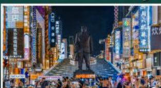
ถนนแดนเดินเขางิงคู่