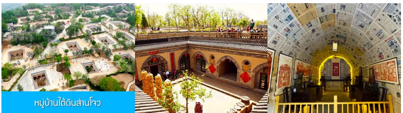
หมู่บ้านใต้ดินสามโจว

หลังอาหารนำท่านเดินทางสู่ เมืองซานเหมินเกีย 三门峡 (ระยะทาง 149 กม ใช้เวลาเดินทางราว 2 ชั่วโมง)