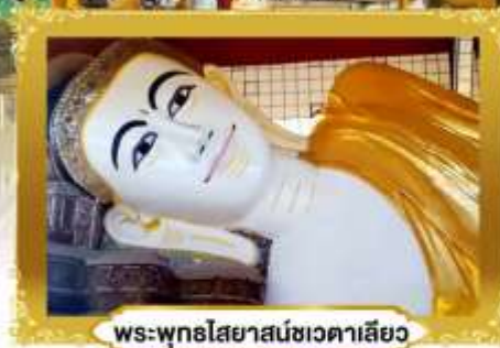
พระพุทธรูปไสยาสน์ชเวตาเลียว