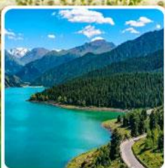
อุทยานเทียนชาน เทียนฉือ