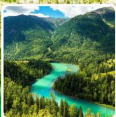
ทะเลสาบคานาสีอ