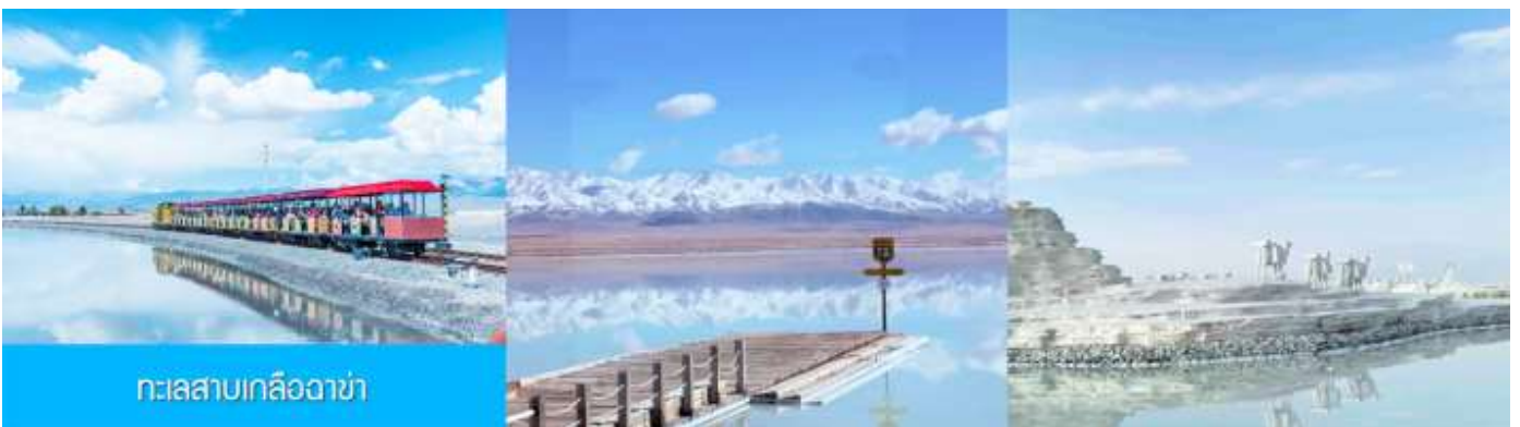
ทะเลสาบเกลือฉาซ่า