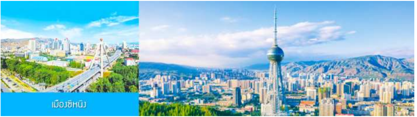
เมืองซีหนิง