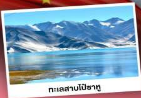
ทะเลสาบโปซาทุ