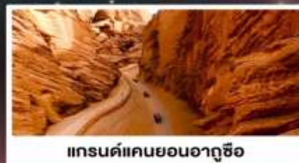
แกรนด์แคนยอนอาถูซื่อ