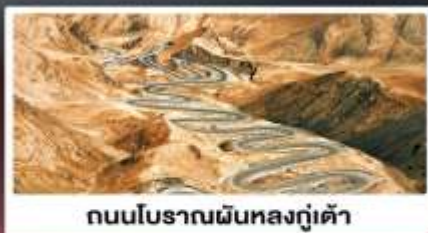
ถนนโบราณผืนหลงกู่เต้า