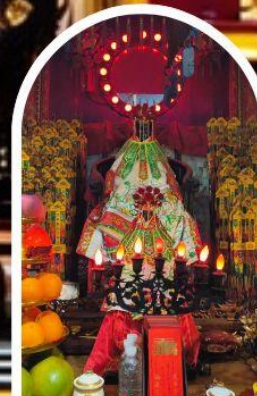
วัดเจ้าแม่กวนอิมอ่องฮำ ขอพรเรื่องเงิน ทรัพย์สิน และความมั่งคั่ง