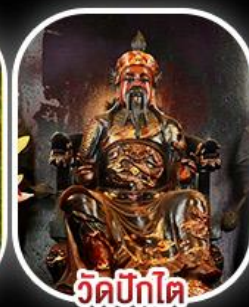
วัดบิกิต