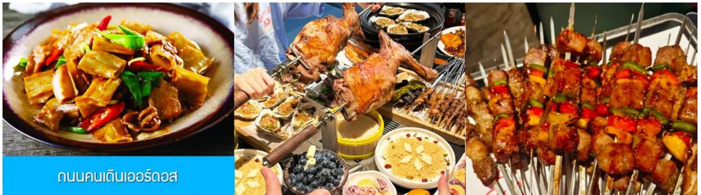
ถนนคนเดินเออร์ดอส

ยิ่งใหญ่เมื่อ 700 ปีก่อน ชม ประตูงเทียน 崇天门 สุคมโหฬารที่แสดงถึงความยิ่งใหญ่ของจักรวรรดิมองโกล ชม จัตุรัสเถิงเก้อหลี่ 腾格里广场 จัตุรัสกลางแจ้งขนาดใหญ่ที่ใช้ประกอบพิธีกรรมต่าง ๆ