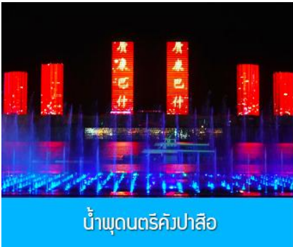
น้ำพุดนตรีคังปาสือ