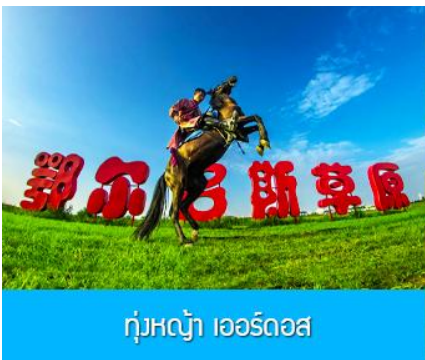
ทุ่งหญ้า เออร์ดอส

พักที่ ORDOS BOYU AIRUI HOTEL โรงแรมระดับ 4 ดาวท้องถิ่น หรือเทียบเท่าในเมืองเออร์ดอส