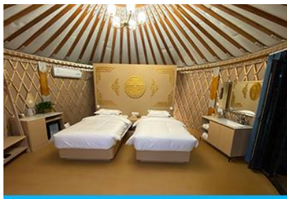
ห้องพักสไตล์มอโกเลียน