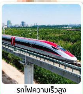
รทไฟคความเรวสูง