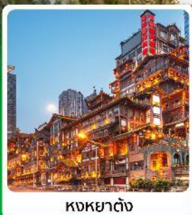
ทงหยาดัง

ไฮไลท์! บินตรงลงเอนซอ เกี้ยวสองเมืองเอนซอ จงซัง หุบเขาสิงโต อุทยานหลุมบ่อฟ้า นั่งรถไฟความเร็วสูง