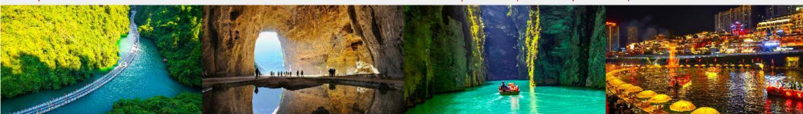
หุบเขาสิงโต