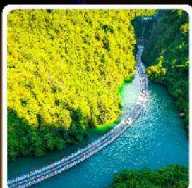
คุบเขาสิงโต

โอไฮโอ! ปืนตรงลงเอนชอ ที่ยวเอนชอเน้นๆจัดเต็มทั่วเมือง คุบเขาสิงโต ผิงซานแกรนด์แคนยอน อุทยานจิ้นลี่ซาน