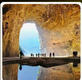
ถ้ำถึงหลง