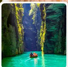
ผิงซานแกรนด์แคนยอน