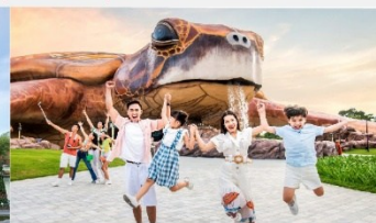
วินเพิร์ล อควาเรียม

*ทางบริษัทฯ ขอสงวนสิทธิ์ในการสลับโปรแกรมทัวร์ตามความเหมาะสมขึ้นอยู่กับสถานการณ์หน้างาน โดยคำนึงถึงผลประโยชน์ของลูกค้าเป็นสำคัญ