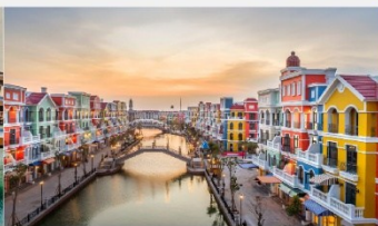
แกรนด์เวิลด์ฟู้ท๊วก