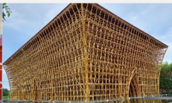
บ้านไม้ไฟ