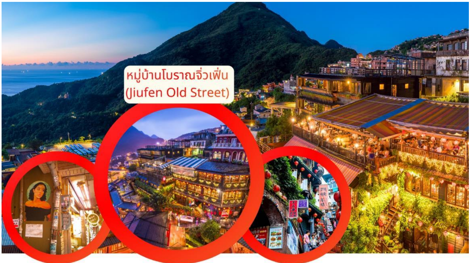
หมู่บ้านโบราณจีวเฟิ่น (Jiufen Old Street)

-วิวทิวทัศน์: สามารถมองเห็นวิวชายฝั่งทะเลจีหลงและภูเขาเค่อล่าง (Keelung Mountain) ได้อย่างชัดเจน