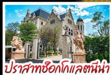
ปราสาทช็อกโกแลตนี้น่า