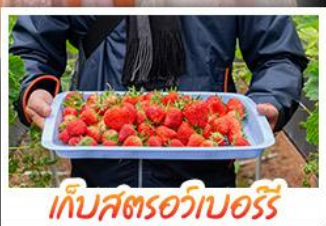
เก็บสตรอว์เบอร์รี่