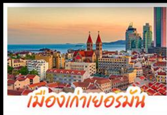
เมืองเก่าเยอรมัน

เมืองเก่าชิงเต่า - สลับกับเมืองโบราณหมิงสุ่ย เมืองเก่าเยอรมัน - ไรไวน์ฟางยู - สวนสตรอว์เบอร์รี่