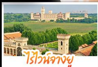
ไรไวน์ฟางยู