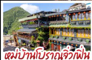
หมู่บ้านบิรอกันจิ่วเฟิน