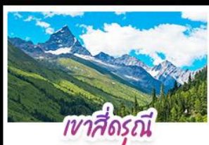
เขาสี่ดรุณี