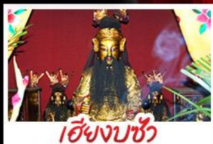
เอียงบูชิว