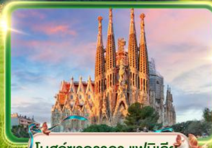
โบสถ์ซากราดา แฟมิลีย