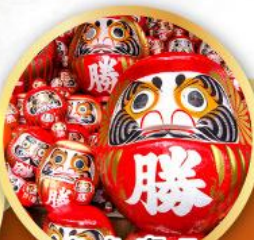
วัดคัตสึโฮจิ (วัดदारุมะ)

ชมความงามของกำแพงหิมะ เส้นทางสายอัลไพน์ทาเคยาม่า (JAPAN ALPS SNOW WALL)