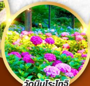
วัดมิมุโระโทจิ