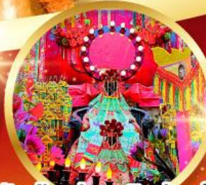
วัดเจ้าแม่กวนอิมฮ้องฮ่า