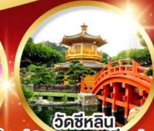
วัดซีหลิน