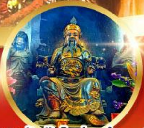
วัดปักไต้ฮ้องฮ่า