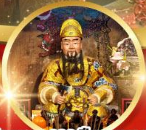
วัดแซก 600ปีหยุนหลอง