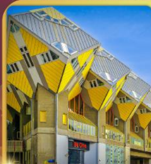
บ้านลูกเต่าโคกคูบัส

“ล่องเรือหลังคากระจก” ชมกรุงอัมสเตอร์ดัม