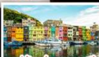
หมู่บ้านประมงหลากสี