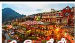
เมืองโบราณจิ่วเฟิ่น

ฟาร์มแกะซิงจิ้ง - ทะเลสาบสวี่นจินตรา จิ่วเฟิ่น - หมู่บ้านประมงหลากสี - ไทเป 101 หมู่บ้านสายรุ้ง - ตลาดล่าหู่ & ซีเหมินติง ปลาประ-ธานธิบดี - เขียวหลงเป่า