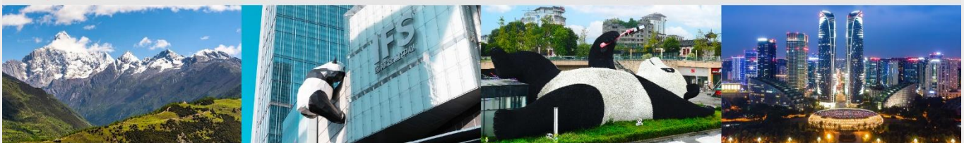
ภูเขาสี่ดรุณี (หุบเขาชวงเจียวโกว)