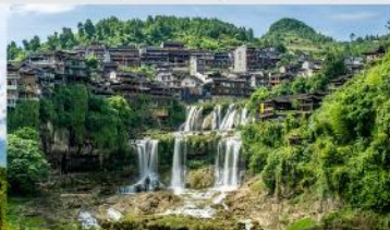
หมู่บ้านโบราณฝูหรงเจิ้น