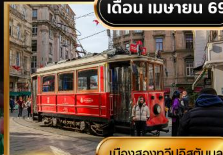
เมืองสองทวีปอิสตันบูล