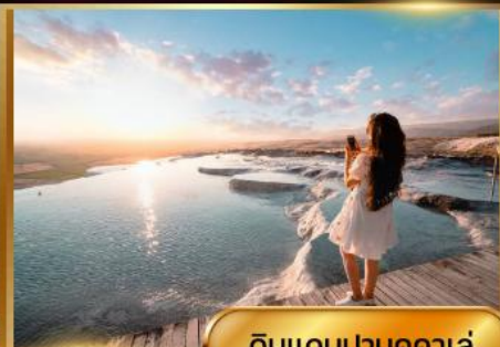
ดินแดนปามุคคาเล่