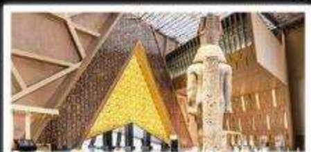
พิพิธภัณฑ์แกรนด์อียิปต์(GEM)

อารยธรรมลุ่มแม่น้ำไนล์ - พีรามิด - อเล็กซานเดรีย - เมมฟิส - ไคโร - โรงแรมระดับ 4 ดาว รวมค่าวีซ่า ต่-ลuggage-เลกราย - อาหารครบทุกมื้อ