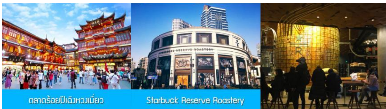
ตลาดร้อยปีฉงหวงเมี่ยว

พักที่ โรงแรม Holiday Inn Express Hotel 4* หรือเทียบเท่าในนครเซี่ยงไฮ้