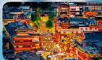
ตลาดร้อยปีเงินหวังเมี่ยว