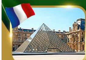
พีระมิดที่ลูฟวร์ ปารีส