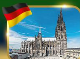
มหาวิหารแห่งเมืองโคโลญ