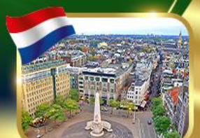
จัตุรัสดีนสแควร์ อัมสเตอร์ดัม