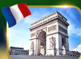
ประตูชัยฝรั่งเศส ปารีส