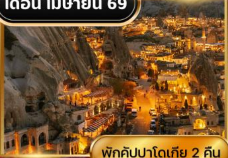
พักคัปปาโดเกีย 2 คืน