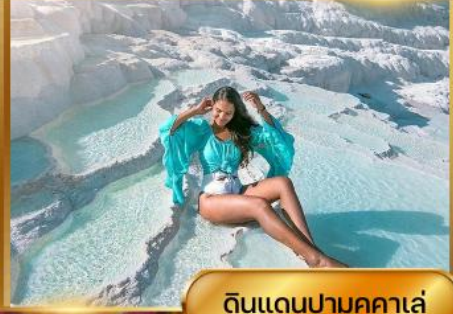
ดินแดนปามุคคาเล่