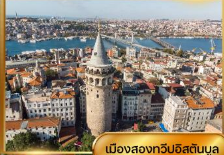
เมืองสองทวีปอิสตันบูล