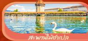
สะพานไมซ์ฮอป

Highlight เยือนหมู่บ้านแสนสวยเซอร์แมท เช็กอินศาลาไทยสุดงามที่โลซาน เที่ยวลูเซิร์น ชมสะพานไม้ชาเปลและอนุสาวรีย์สิงโต ซาลี แพลสซึน ชมประติมากรรม The Fork และปราสาทซิลลองริมทะเลสาบ เยือนมิลาน มหาวิหารดูโอโม เกียวเวนิส เมืองลอยน้ำสุดโรแมนติก อินกับรักอมตะที่บ้านจูเลียต และช้อปปิ้งจุใจที่ Serravalle Outlet