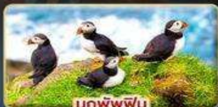
นกพิฟฟิน

📅 เดินทาง : 30 เม.ย. - 07 พ.ค. | 23-30 ก.ค. 69