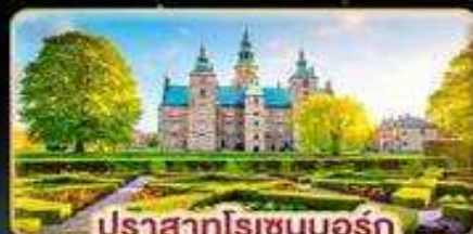
ปราสาทโรเซนบอร์ก